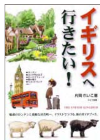
『イギリスへ行きたい!』片岡れいこ著 メイツ出版