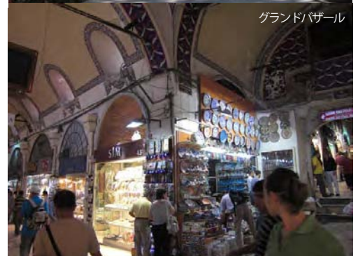
グランドバザール