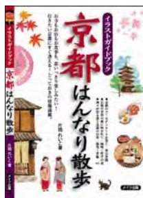
『イラストガイドブック 京都はんなり散歩』片岡れいこ著 メイツ出版

1967年2月京都生まれ。1989年京都市立芸術大学美術学部版画専攻卒業。グラフィックデザイナーとして8年間、勤務を経て独立。1992年イギリス語学留学。現在、版画家、イラストレーター、デザイナーとして活動。日本版画協会準会員、KYOTO版画2008選抜作品展アートレインボー賞受賞など。1999年、「ダイヤモンド・チチ」ベーストとしてCD『愉・快・楽・園』発売。2004年迄「劇団ひかり」所属。ヨガ講師。18歳から乗り始めたバイクではほぼ全国を一人旅。国内外問わず、行った事のない場所や、見た事もない地球に出会おうのが好き。片岡れいこホームページ http://a-nicola.com/