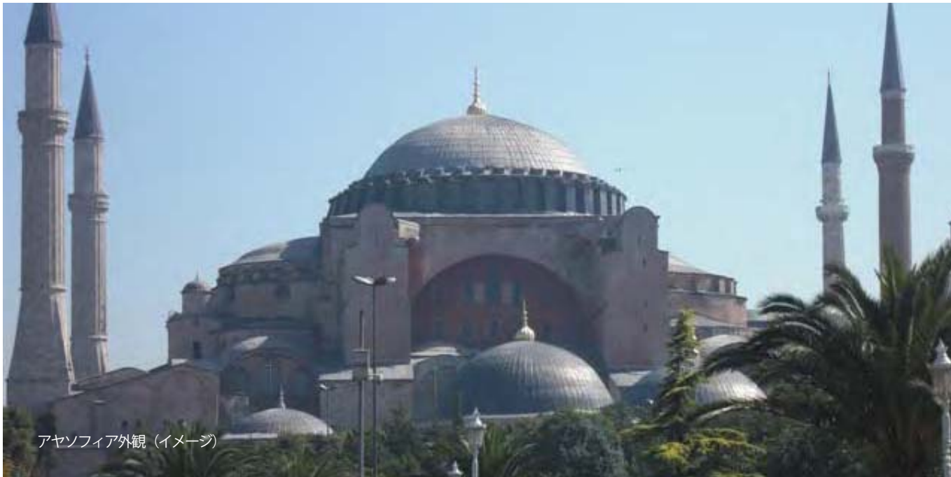
アヤソフィア外観 (イメージ)

総合旅行業務取扱管理者とは、お客様の旅行を取り扱う支店・営業所での取引に関する責任者です。 この旅行の契約に関し、担当者からの説明にご不明な点がございましたら、ご遠慮なく上記の取扱管理者にご質問ください。