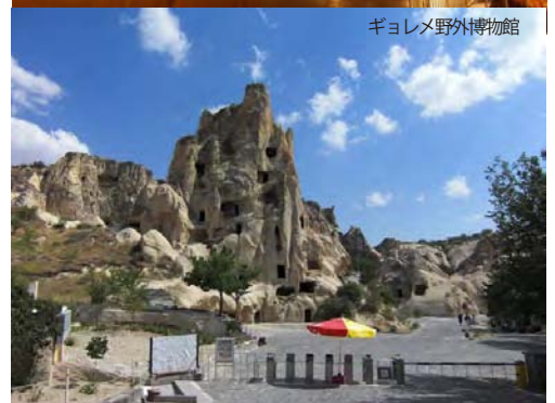
ギョレメ野外博物館