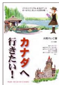
『カナダへ行きたい!』片岡れいこ著 メイツ出版