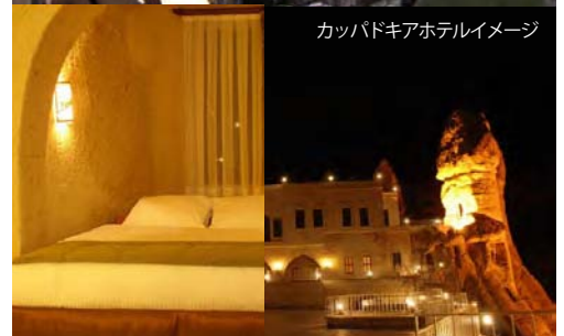
カッパドキアホテルイメージ