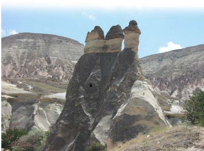
バジャパー (キノコ岩)